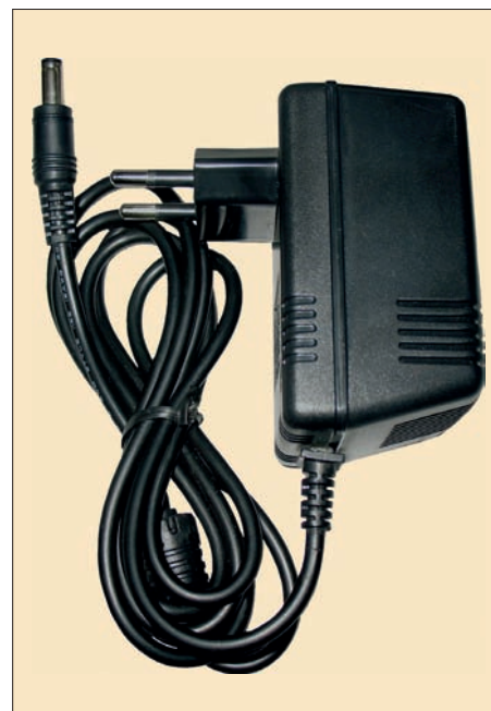
Сетевой адаптер AT-12/05

Оборудование, подключаемое к источнику питания, рассчитано на определенное номинальное напряжение. Поскольку оно может находиться на значительном расстоянии от источника питания, то важным фактором являются