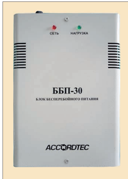
Источник бесперебойного питания ББП-30

● ББП-30 предназначен для питания нагрузки напряжением 12 В с током потребления 3 А. Максимальный ток нагрузки – 4,9 А. Данный блок бесперебойного питания имеет встроенную электронную защиту от короткого замыкания и превышения нагрузки по току и мощности. ББП-30 также имеет функцию защиты АКБ от глубокого разряда.