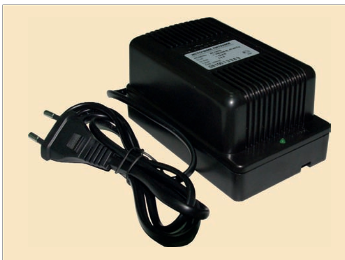
Сетевой адаптер AT-12/15

Одним из важнейших компонентов любой низковольтной системы являются источники питания. Этот сегмент рынка, как и многие другие в сфере производства систем безопасности, находится в постоянном развитии и совершенствовании: идут процессы уменьшения габаритов, улучшения характеристик, адаптации под условия российских сетей и т.д. Какие же преимущества открывают перед пользователем импульсные источники питания и какие продукты существуют в данном сегменте?