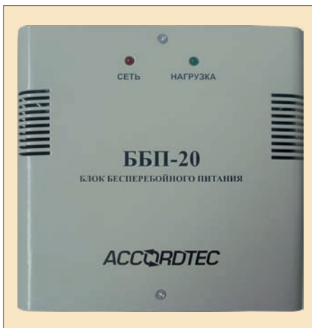
Источник бесперебойного питания ББП-20

● ББП-20 – экономичный источник питания. Предназначен для питания нагрузки напряжением 12 В с током потребления не более 2 А. Данный источник питания может идти от сети переменного тока с напряжением от 80 до 265 В. Максимальный ток нагрузки – 2,5 А. ББП-20 имеет встроенную электронную защиту по выходу от короткого замыкания и превышения тока нагрузки. Цепь аккумулятора защищена предохранителем. Имеет индикацию наличия сети и индикацию наличия 12 В на выходе. Для компенсации падения выходного напряжения на соединительных проводах предусмотрена регулировка напряжения на выходе в диапазоне от 12 до 15 В.